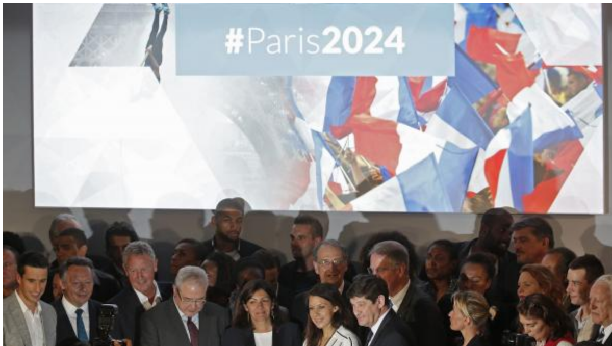
Paris chính thức xin tổ chức Olympic 2024.

Khi tung chiến dịch vận động cho Thế vận hội Paris 2024 vào ngày 25/09/2015, Ủy ban Thế vận Pháp đã tổ chức một cuộc tập hợp rất « hoành tráng », quy tụ rất nhiều tên tuổi không chỉ trong giới thể thao mà của cả các giới khác. Teddy Riner, tám lần vô địch nhu đạo thế giới và danh thủ bóng rổ nổi tiếng thế giới Tony Parker, hiện thi đấu tại Mỹ, đã đến để bày tỏ sự ủng hộ đối với Paris.