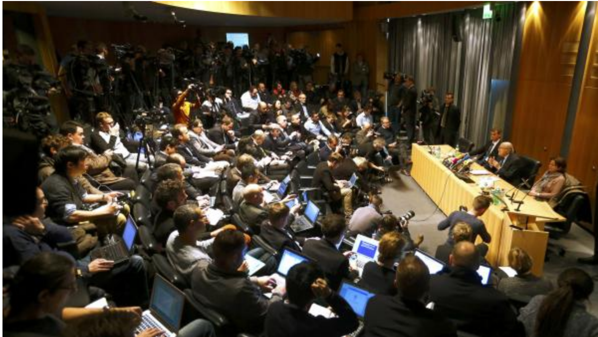
Sepp Blatter thông báo hôm 21/12/2015 việc kháng quyết lên Tòa án Trọng tài Thể thao

Đối với ủy ban đạo đức FIFA, hợp đồng ngày 25/08/1999 giữa hai chủ tịch FIFA và UEFA không hề có cơ sở pháp lý, trong khi đó, ông Sepp Blatter, với tư cách chủ tịch FIFA, đã dựa vào hợp đồng này để trả số tiền nói trên cho ông Michel Platini.