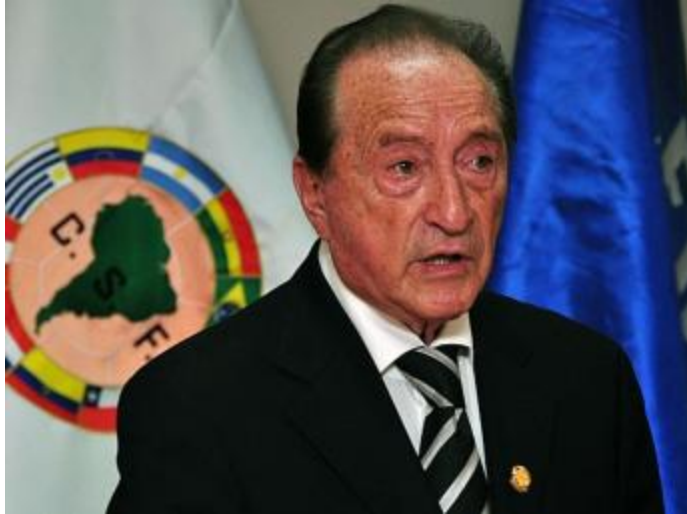
Cựu chủ tịch Liên đoàn bóng đá Nam Mỹ