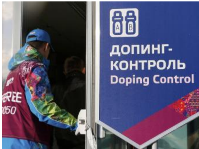
Vận động viên điền kinh Nga có thể bị loại khỏi Thế vận hội Rio 2016

Giới chuyên môn thể thao đều đón nhận thông tin về vụ bê bối doping của điền kinh Nga với sự phẫn nộ đặc biệt, tuy vậy nhiều người không tỏ ra ngạc nhiên về chuyện này, vì đó chính là di sản của thời kỳ Liên xô.