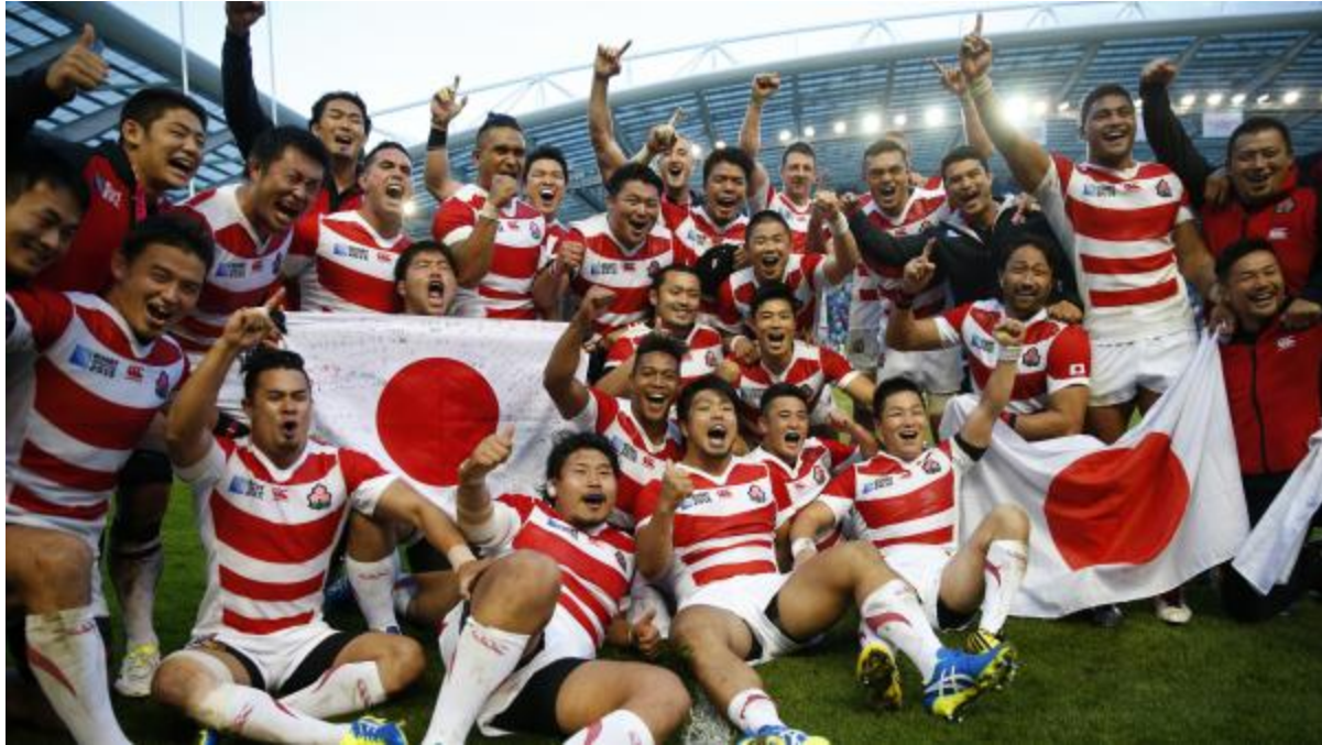
Các tuyển thủ Nhật đã hạ đội tuyển Úc Springbok với tỷ số 34-32 trên sân Brighton

Về môn rugby, đội tuyển Nhật đã đi vào lịch sử với kỳ công hạ được Nam Phi, một trong những đội mạnh nhất hành tinh chúng ta, tại Giải vô địch rugby thế giới 2015 ở Anh Quốc. Ngày 19/09/2015, sau một trận đấu gay cấn, ngoạn mục, các tuyển thủ xứ Mặt trời mọc đã hạ đội tuyển mệnh danh Springbok với tỷ số 34-32.